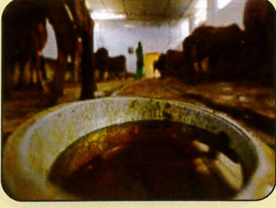
દેશી ગાયનું ગૌમૂત્ર ૨૦ લીટર