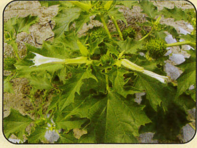
ઘતુરાના પાનની ચટણી ૨ કિલો