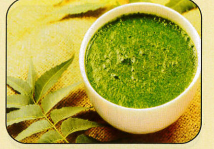
કડવા લીમડાના પાનની ચટણી ૩ કિલો